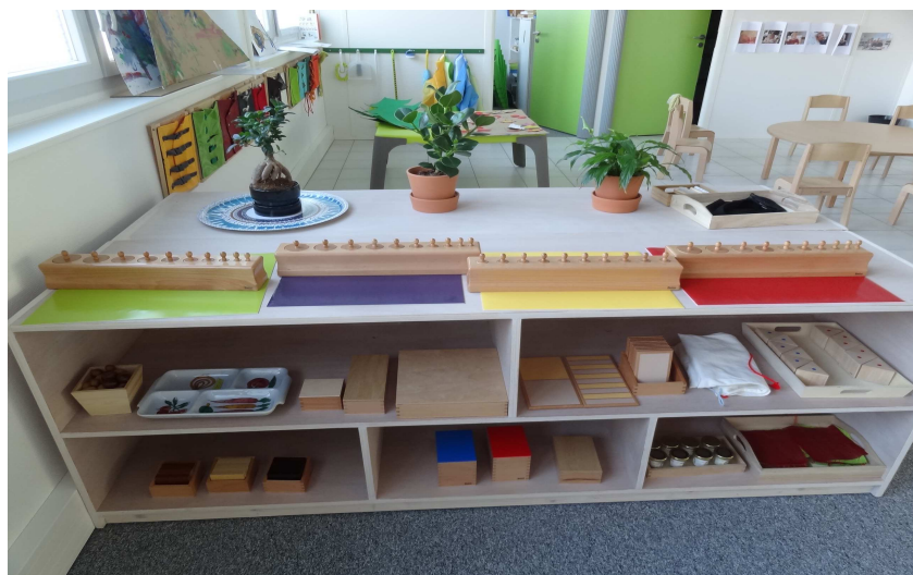
Photographie de l'Ecole Montessori de Dijon Au premier plan, l'étagère "Vie sensorielle" et en arrière-plan, l'espace "Vie pratique".