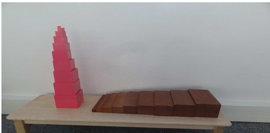
Photographie de l'école Montessori de Dijon: "Tour rose" et "Escalier marron"

Selon Maria Montessori , l'enfant est curieux, passe par des périodes sensibles pendant lesquelles il lui est très facile d'apprendre par absorbance et chaque enfant progresse à son propre rythme . Il suffit de lui fournir le matériel adapté à ses besoins pour nourrir cette curiosité et lui permettre d'apprendre de manière autonome selon ses besoins et envies du moment. Le matériel pédagogique Montessori est ludique, esthétique, auto-correctif et adapté aux différentes tranches d'âge des enfants.